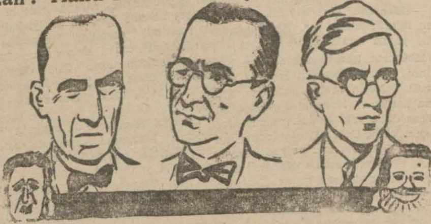
27 sene evvel Darülbedayi kurulurken aktör olmak üzere müracaat edenlerden üç maruf sima: Ali Naci, Peyami Safa ve Halid Fahri Ozansoy

İmtihan günü... Letafet apartmanı, nın üst katı maşher... Merdivenin başındaki sofadan tâ koridorun yarısı, na kadar, başbaşa, omuz omuza, kız erkek bütün namzedler heyecan içinde bekliyor... Kızların çoğu Ermeni, bazıları Rum... Kim bilir belki çerinde La Dame aux camélias'ı Fransızcasından değil de Türkçesinden okuyup biraz anlayabilen bir iki de Musevi matmazel var. Belki diyorum, çünkü buna pek emtin değilim. Ne çare, zaman! hatıra zayıflıyor.