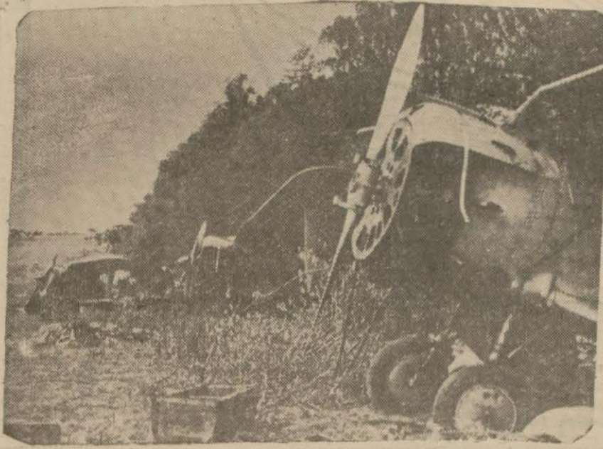
Bir Sovyet tayyare meydanında Almanlar tarafından tahrib edilen ve ele geçirilen tayyareler

Fransız askerî münakkidleri Rus ordusunda inhilâl alâmetleri gördüklerini iddia ediyorlar